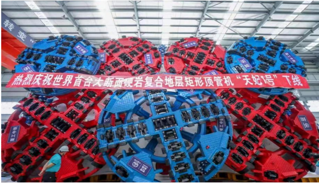
世界首台大断面矩形硬岩顶管盾构机“天妃1号”