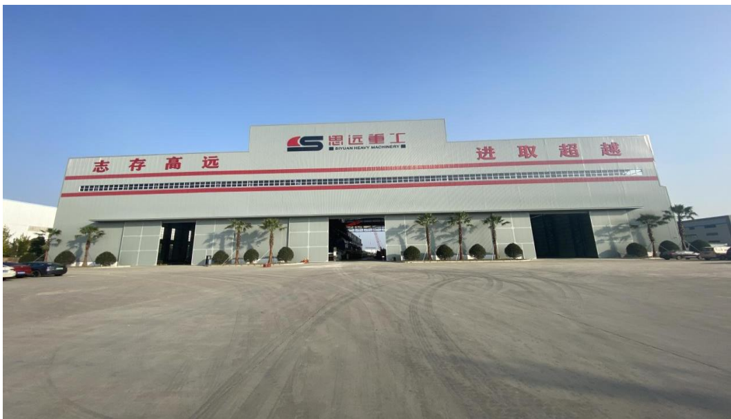
中铁装备德阳组装基