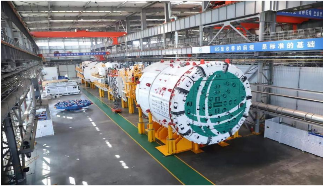
世界首台大直径（9.53米）超小转弯TBM“抚宁号”