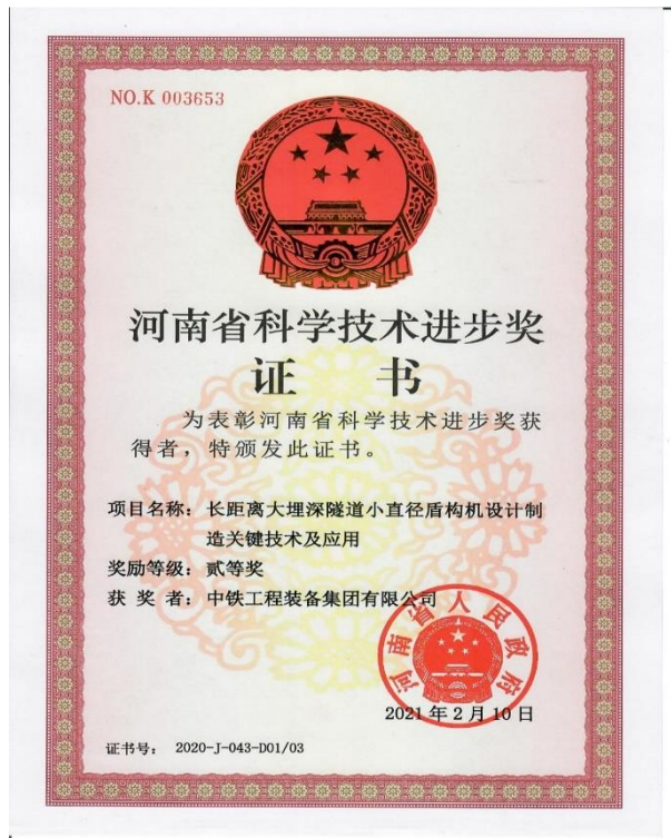
2021年2月 中铁装备荣获河南省科学技术进步奖二等奖