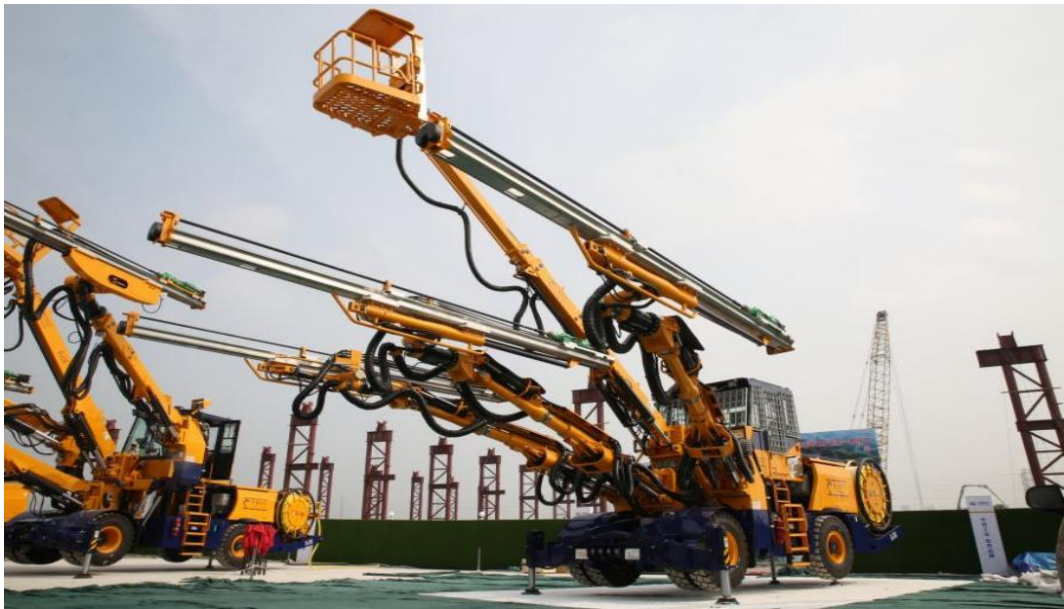
高原型三臂凿岩台车