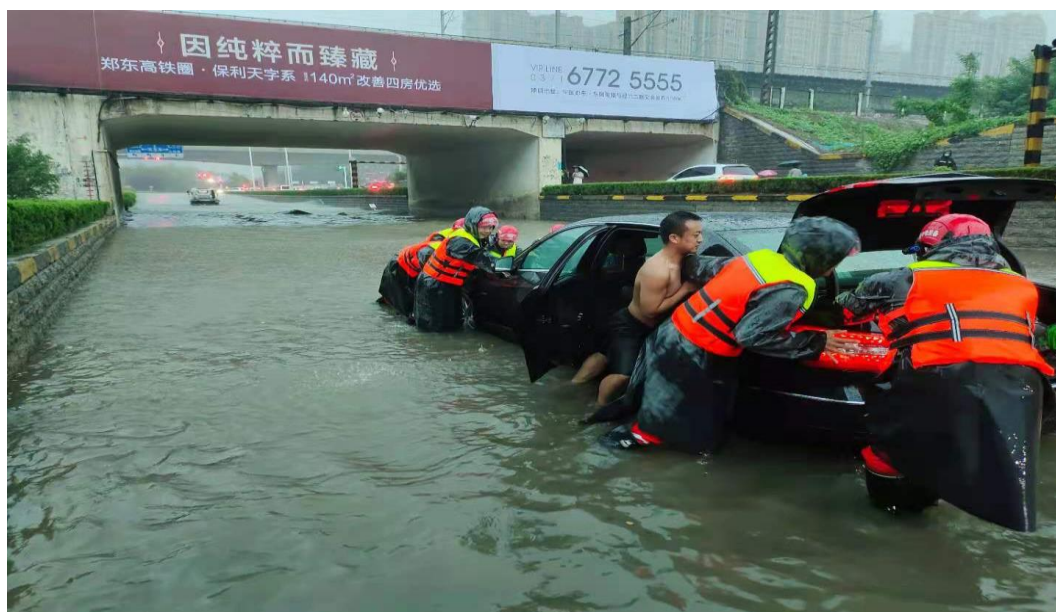
中铁装备团员青年参与 7.20 防汛救援