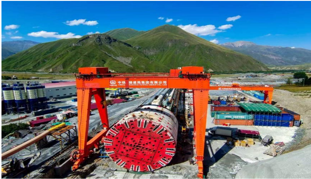
世界最大直径（ \phi 15.08 米）全断面硬岩掘进机（TBM） “高加索号”

3. 超大直径泥水盾构机“大湾区号（中铁 1068 号）”应用于新建深江铁路珠江口隧道项目，助力粤港澳大湾区重大交通项目建设，深江铁路正线全长 116.12 公里，位于粤港澳大湾区中心，是全国“八纵八横”高速铁路网沿海通道的重要组成部分，为对接服务“一带一路”倡议、支持粤港澳大湾区和中国广东自贸区建设的重大交通基础设施。深江铁路建成开通后有利于打造粤港澳大湾区半小时生活圈、经济圈，可直接辐射带动粤东粤西与珠三角的区域协调发展，深圳的前海自贸片区与广州的南沙自贸片区可实现半小时高铁互联互通。