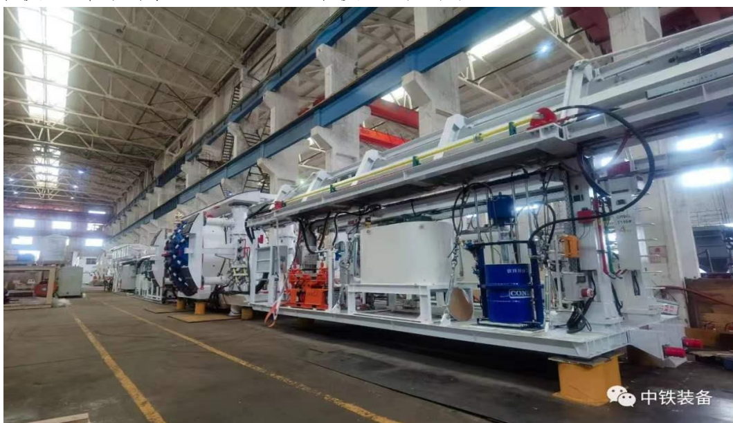
世界首批双模联络通道掘进机

15 米级盾体自制，实现了公司的质量、进度、成本预期目标。同时引入坡口机器人、焊接机器人、半自动埋弧焊的等设备，初步实现了驱动箱等部件智能化制造，有效提供公司市场竞争力。同时在专用设备领域，不断优化产品结构设计，创造性的引入深熔焊、超长焊枪设备，超厚板焊接质量明显提高，焊接效率提高 10%以上，焊接成本降低 20%以上。