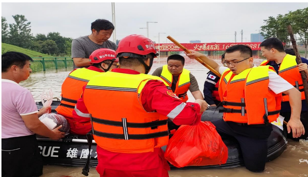
中铁装备“穿山甲救援队”参与 7.20 防汛救援

场。公司党委认真开展受灾人员慰问和抗洪救灾先进个人和先进集体表彰，发放慰问和表彰款项 120 余万元。