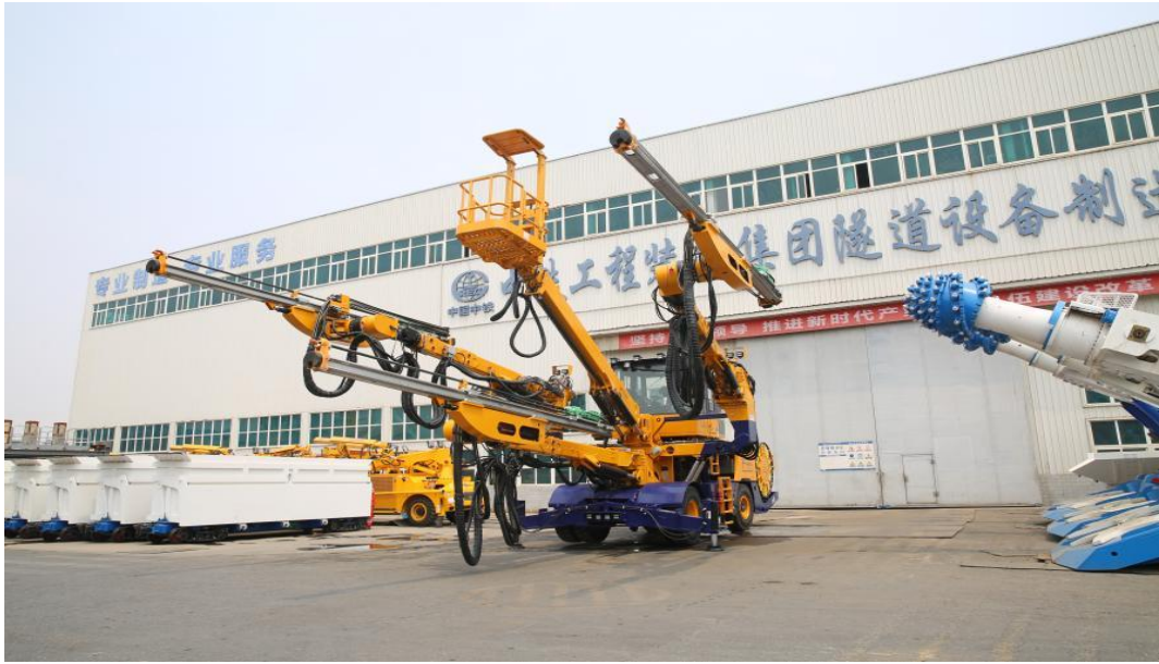
全电脑三臂凿岩台车