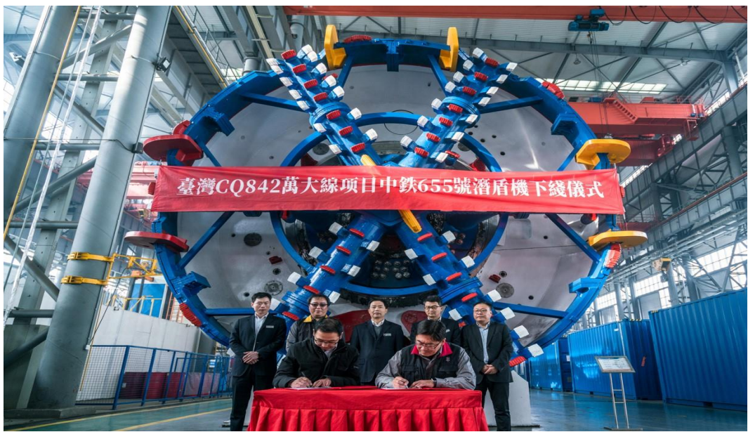
台湾万大线 CQ842 下线仪式