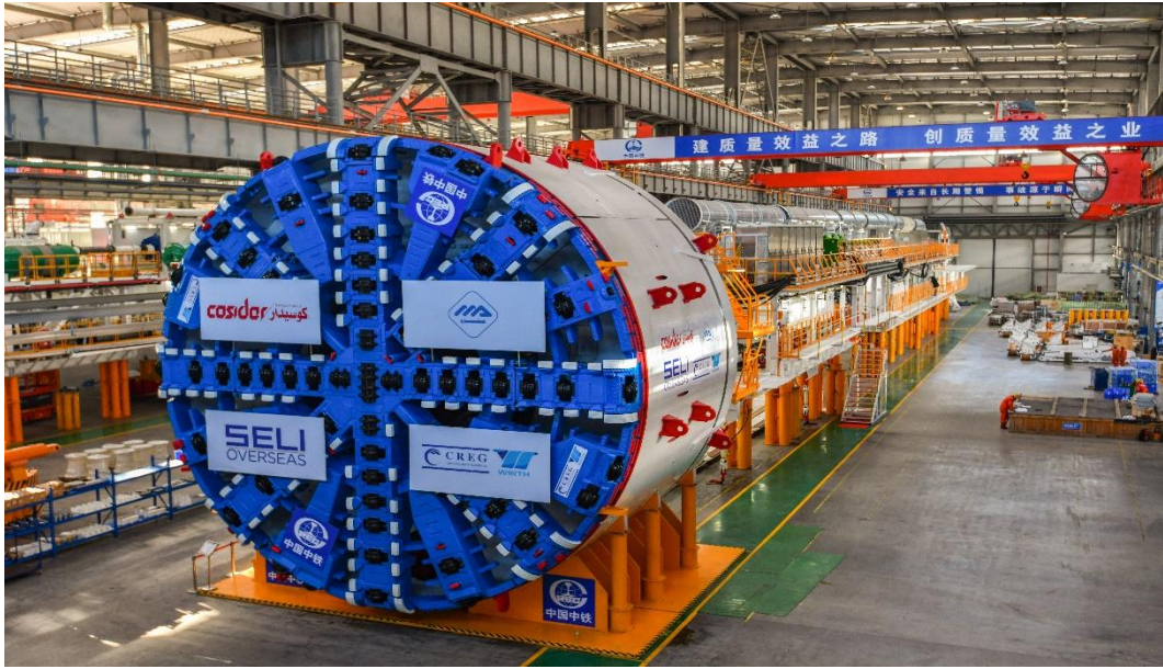
阿尔及利亚项目中铁 665 号下线仪式