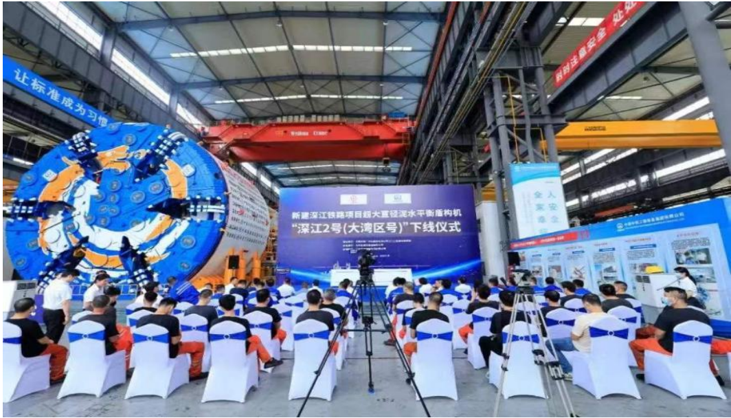
超大直径泥水盾构机“大湾区号”

4. 智能湿喷台车、全电脑三臂凿岩台车、高原型三臂凿岩台车、高原型智能锚注一体台车和高原型双臂湿喷台车等一大批极端环境隧道施工专用设备成功下线并助力青藏高原路网建设。