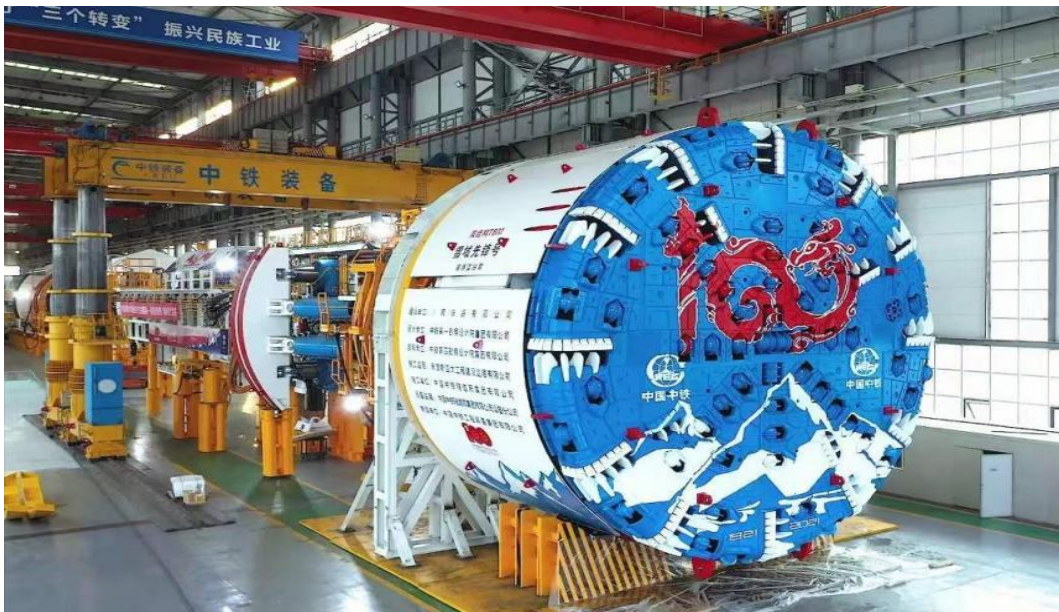
国产首台高原高寒大直径硬岩掘进机“雪域先锋号”

1. 国产首台高原高寒大直径硬岩掘进机“雪域先锋号”，该设备是目前国产最大直径的敞开式 TBM，也是世界首台双结构 TBM，应用于川藏铁路建设，为极端地质条件下隧道施工提供了强有力的支撑，具有十分重要的意义。