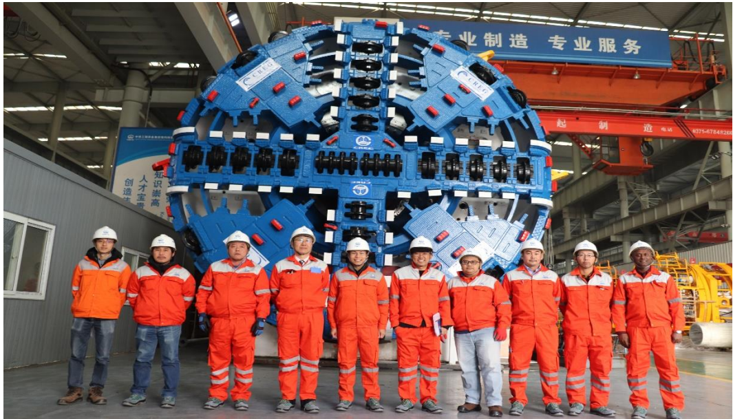
新加坡 C882 项目设备下线 (FAT Ceremony of C882 TBM)