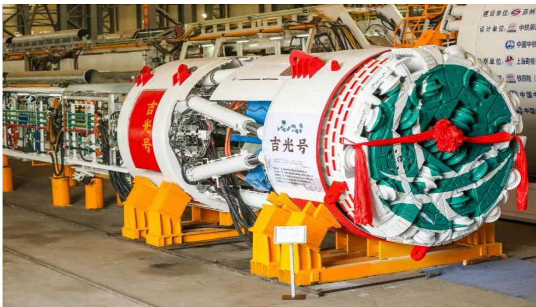
超小转弯硬岩掘进机“吉光号”