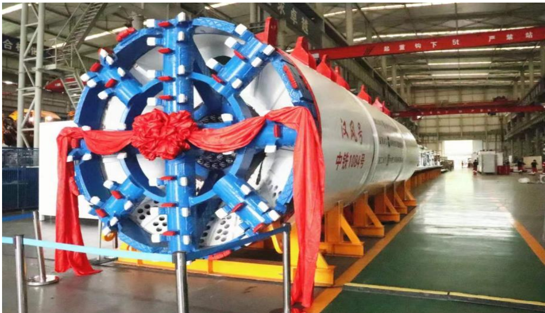
国内最小直径泥水平衡盾构机“汉风号”