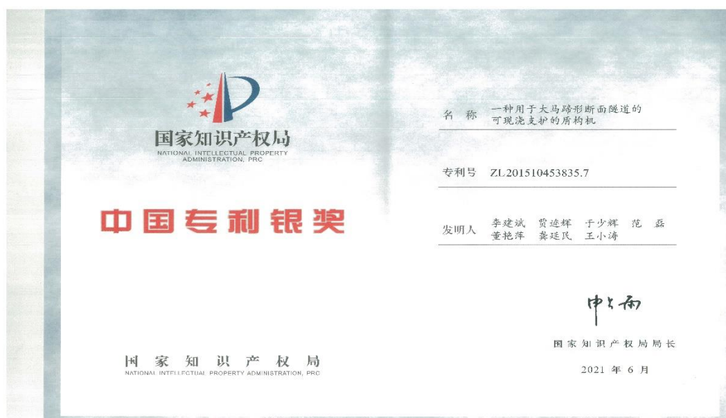
2021 年 6 月 中铁装备获得国家知识产权局中国专利奖银奖

键技术及应用”项目荣获河南省科学技术进步奖一等奖；“高磨蚀地质滚刀关键技术及应用”“长距离大埋深隧道小直径盾构机关键技术研究及应用”两个项目均荣获河南省科学技术进步奖二等奖；“适应城市地铁小转弯半径的双护盾 TBM 研制及应用”“盾构装备掘进载荷设计与风险防控关键技术及应用”两个项目均荣获河南省科学技术进步奖三等奖。2021 年 6 月，中铁装备“一种用于大马蹄形断面隧道的可现浇支护的盾构机”产品及“一种 TBM 在掘岩体状态实时感知系统和方法”项目分别获得由国家知识产权局颁发的中国专利奖银奖、中国专利奖优秀奖。2021 年 9 月，中铁装备“5G+智慧盾构”项目在第二届促进金砖工业创新合作大赛中荣获二等奖。2021 年 12 月，在首届全国博士后创新创业大赛上，中铁装备《全断面掘进机换刀机器人关键技术及其产业化》项目荣获铜奖，该奖项由中华人民共和国人力资源和社会保障部颁发。