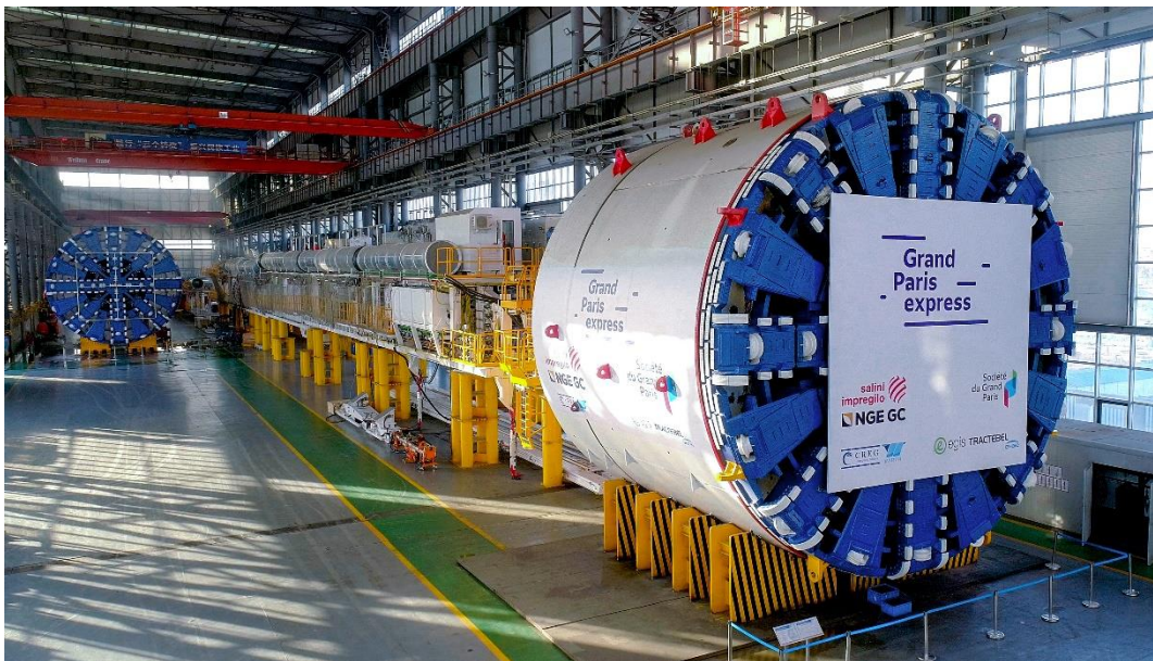
巴黎项目法国巴黎项目中铁 777&778 号下线仪式