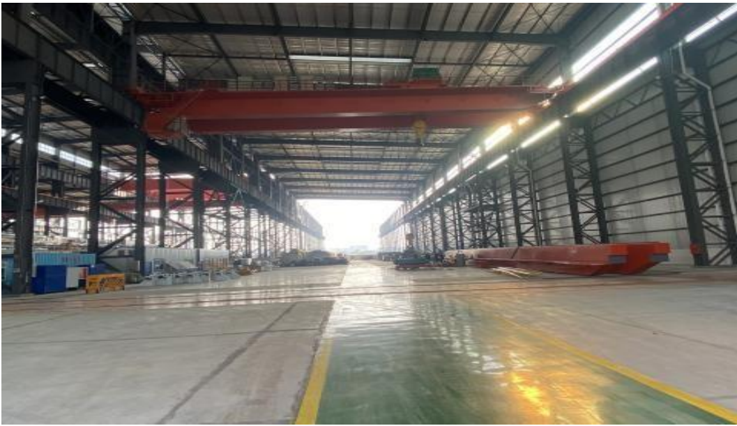
中铁装备德阳基地车间内部图

中铁装备 2021 年 9 月新启动德阳组装基地，位于四川省德阳市旌阳区，厂房约 35886 平方米，共三跨车间，目前租赁车间为 2 跨，长度为 143 米，总宽 72 米，面积为 10296 平方米，可满足直径 1.5 米~8 米的盾构整机组装以及 2 台常规机的预组装；待车间完全建成投入使用后，可满足 1.5 米~17 米的盾构整机组装。