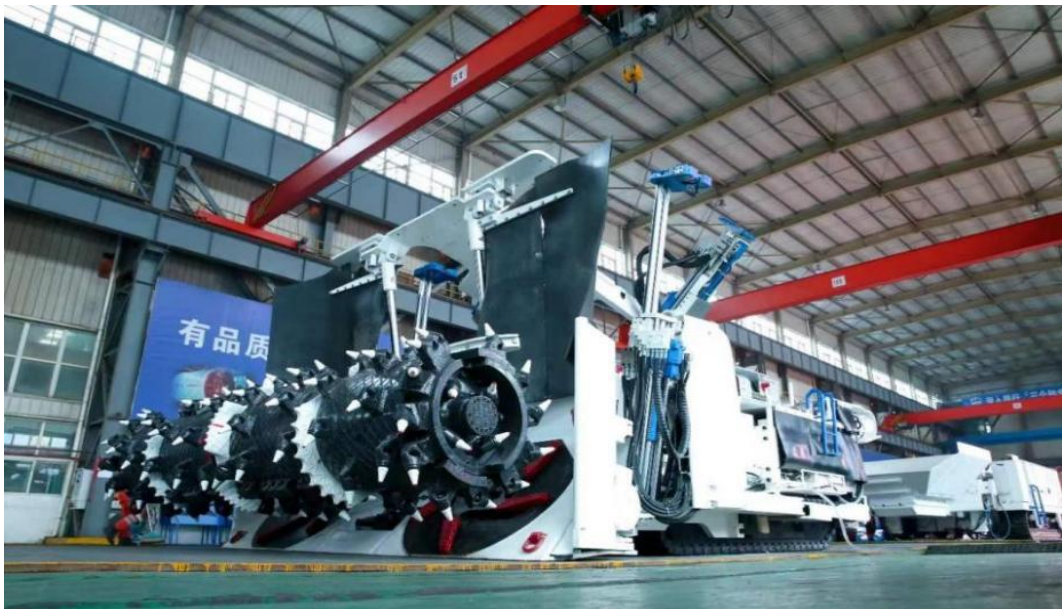
国内首台套低矮型半煤岩快速掘锚成套装备